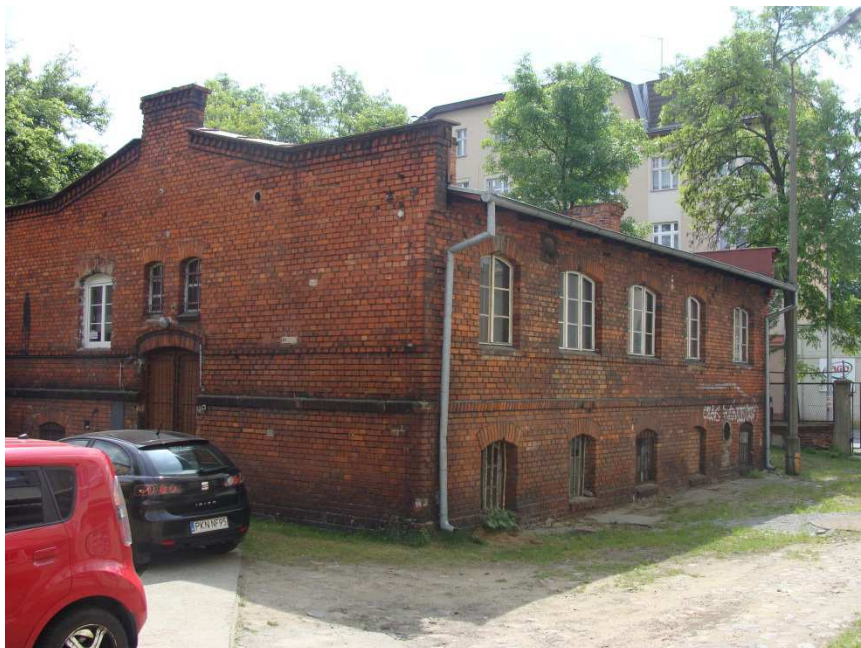
Elewacje północna i zachodnia budynku głównego.

Opisywane budynki to dwukondygnacyjna, podpiwniczona budowla na planie prostokąta. Dach o konstrukcji drewnianej, lekko dwuspadowy kryty papą do której przylegają od strony północno-wschodniej niepodpiwniczone, szeregowo usytuowane parterowe zabudowania o drewnianej konstrukcji dachu krytym papą. Parterowe zabudowania przylegają do działek 148, 147/2 i 147/1 w obrębie 112 ( Hetmańska 31 i Mazowiecka 26). Elewacje zabudowań z nietynkowanej cegły z dużą liczbą spękań i ubytków. Dach na budynkach parterowych zapadnięty. Elewacje pokrywają instalacje; odgromowa, telefoniczna, oświetleniowa, elektryczna i gazowa. Brak miejsc niebezpiecznych dla ptaków.