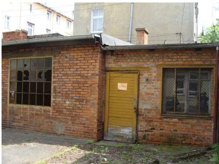
Zabudowania parterowe, część południowa.