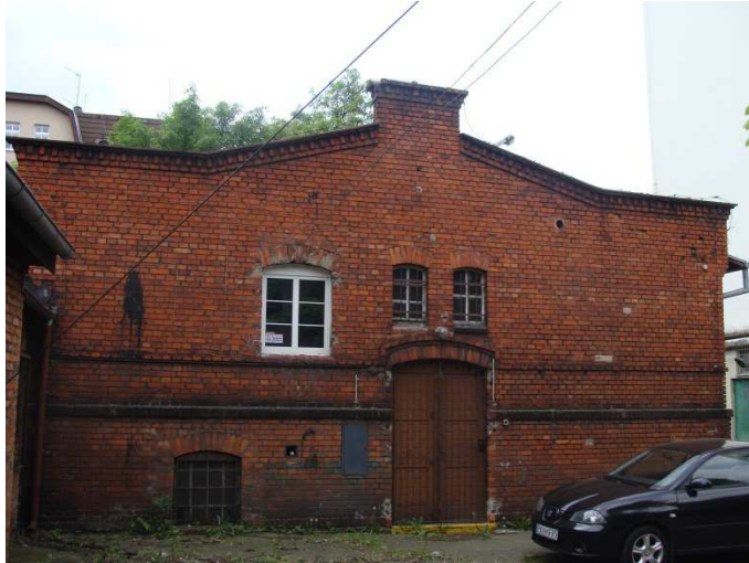
Elewacja północna budynku głównego.