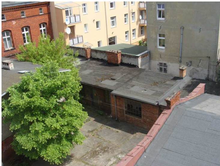
Widok ogólny zabudowań parterowych.