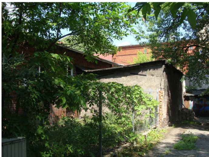
Elewacja wschodnia, widok z ulicy Mazowieckiej.