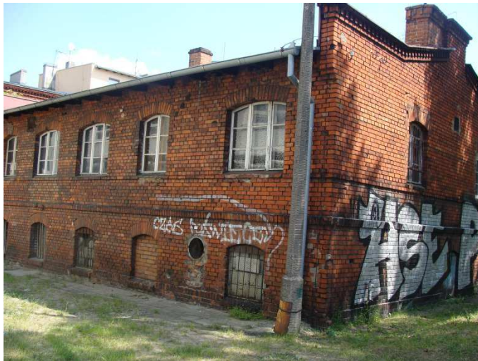
Elewacja południowa i zachodnia budynku głównego, widok z ulicy Mazowieckiej.