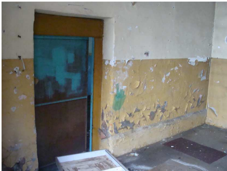
Przykładowy stan wnętrza budynków.

W opisywanych budynkach nie stwierdzam śladów bytowania prawnie chronionych gatunków nietoperzy.