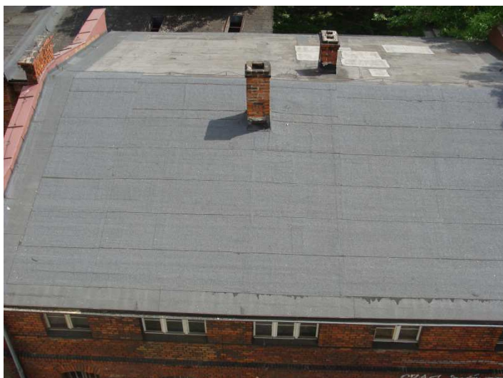
Widok dachu budynku głównego (podpiwniczonego).