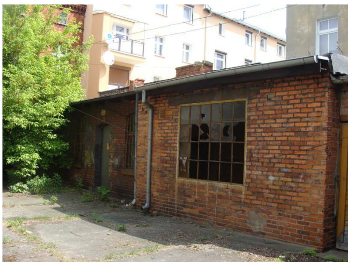
Zabudowania parterowe, część północna.